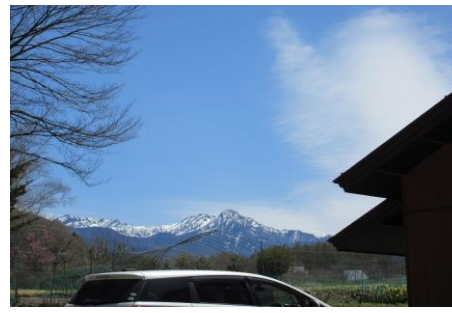
駐車場から望む ダイナミックな八ヶ岳