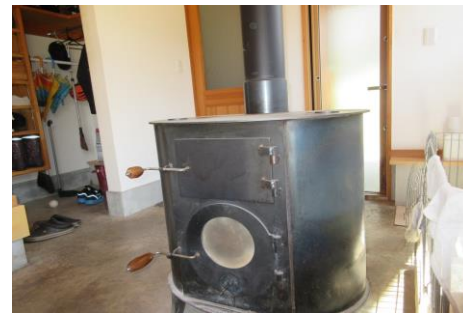
土間の薪ストーブのみで 冬もポカポカ！