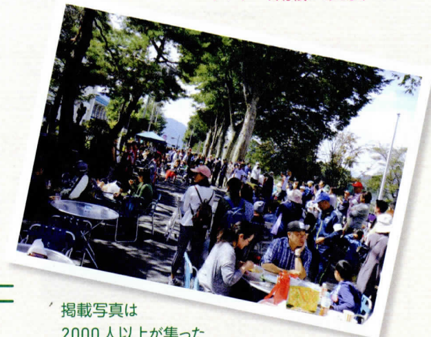
掲載写真は 2000人以上が集った 前回の玉川ケヤキフェスの様子です